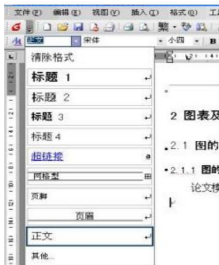
图 1.1 样式